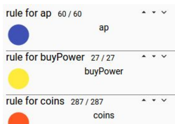
Figure 2. Exemple de feuille de style.

Les groupes d'obsels sont définis par une feuille de style qui correspond à une liste de règles (Figure 2). Cette liste de règles est une forme normale disjonctive de règles primaires. Une règle primaire correspond à une comparaison de valeurs sur un attribut d' obsel ou correspond à un type d' obsel . Chaque obsel de la trace sera affiché via le symbole de la règle qui lui correspond le plus.